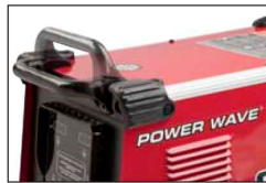
Se muestran los mangos reversibles